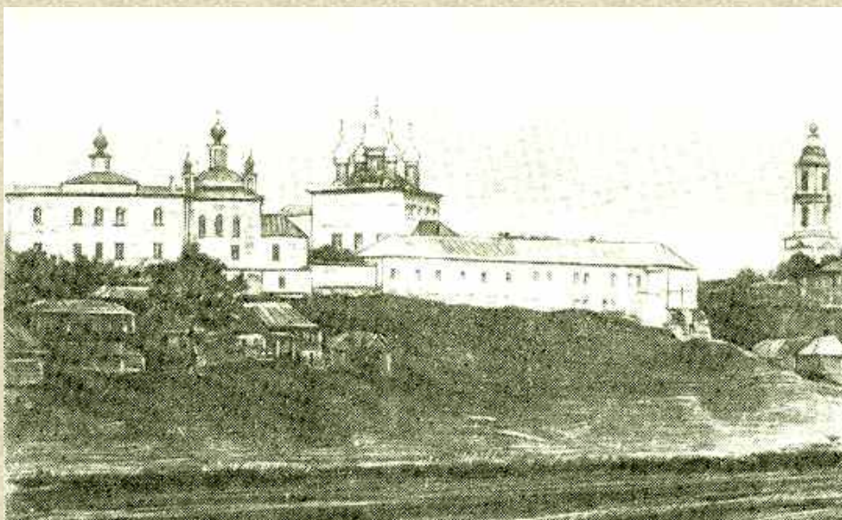
Белевский Спасо-Преображенский монастырь

Монастырь находился недалеко от Оптиной пустыни, что позволяло молодому настоятелю постоянно общаться с оптинскими старцами, которые высоко ценили его духовную настроенность и часто сами направляли к нему людей для духовного руководства. Побывав в Саровском и Дивеевском монастырях, о. Петр познакомился с блаженной Прасковьей Ивановной Дивеевской, которая оказывала ему особое расположение. Блаженная даже подарила ему своей работы холст, из которого ему впоследствии сшили архиерейское облачение, и он бережно его хранил, предполагая быть в нем погребенным.