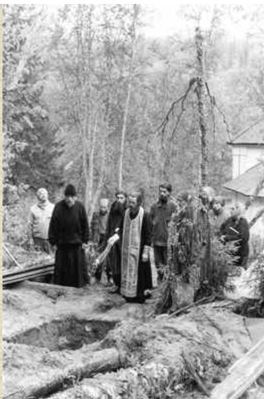
Панихида у могилы архиепископа Петра. Анзер. 17 июня 1999 года

Как местночтимый святой Воронежской епархии владыка был канонизирован в 1999 г. Рабочая группа при Синодальной комиссии по канонизации святых установила место захоронения священномученика Петра (Зверева), архиепископа Воронежского и обнаружила групповые захоронения периода Соловецкого лагеря. На месте погребений была отслужена панихида и поставлены могильные кресты. Честные мощи священномученика Петра (Зверева) были обретены 17 июня 1999 года за алтарем церкви Воскресения Христова. Мощи были положены в Спасо-Преображенском соборе Соловецкого монастыря, а затем перенесены в монастырскую церковь святителя Филиппа, митрополита Московского. На месте обретения мощей, за алтарем церкви Воскресения Христова, поставлена часовня.