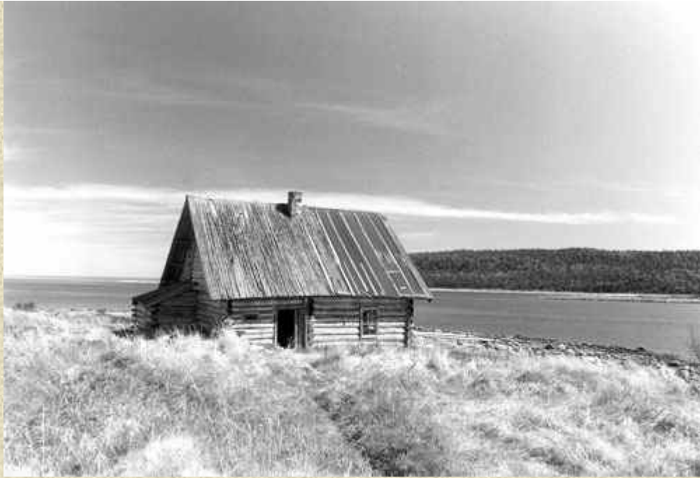
Анзер. Троицкая командировка

Сколько боли, скорби, изнурительного труда в невыносимых погодных условиях, издевательств над заключенными скрывалось за этими строчками, но владыка не проронил ни слова, которым мог осудить всю нечистоту и беззаконие, царившее в концлагере. Еды катастрофически не хватало, нужных медикаментов не было, да и кто обращал внимание на состояние узников, если они считались полуживой рабочей силой? Из тысячи заключенных, находившихся в то время на острове, за зиму 1928–1929 года умерло пятьсот человек. Вблизи храма Воскресения Господня сразу за монастырским кладбищем были вырыты большие братские могилы, куда складывали всю зиму умерших, а сверху ямы закрывали лапником. И все же архиепископ не терял надежды, благодаря Бога и людей, молясь о страждущих, поддерживая угнетенных. «Только теперь имею возможность отправить вам желаемую вами открытку с видом Варваринской часовни, - писал владыка. - Не могу словами выразить моей глубочайшей благодарности за все решительно и могу лишь молиться за вас, пока Господь даст жизни. Да хранит вас Бог от всех козней дьявольских ради вашего чистого и бескорыстного усердия! За молитвы многих я пока жив и здоров. Особенно по сердцу пришлось мне ваше пожелание к празднику не чувствовать острой боли и тоски. Спаси Господь... Я же кровно соединен со своей паствой и не могу не молиться за нее и не беспокоиться о ее благополучии, мире, здравии, спасении. Вам, вашим родным и всем мир и Божие благословение. Благодарность. Сана на адресах никто не пишите...»