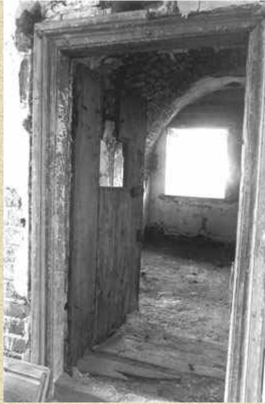
Анзер. Одна из бывших тюремных камер больницы, устроенной в храме Распятия Господня

В этот день врачи заметили улучшение в состоянии владыки, решив, что кризис миновал, но святитель Петр чувствовал приближающуюся кончину. Перед смертью он несколько раз написал на стене карандашом: "Жить я больше не хочу, меня Господь к Себе призывает".