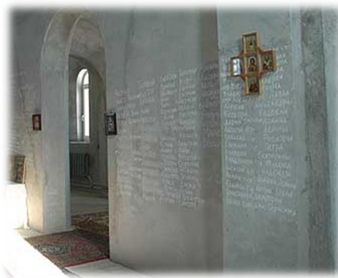
Имена жертвователей на стенах алтаря